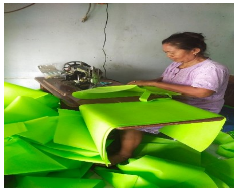
Gambar 2. Kegiatan Menjahit Tas Ringan

produsen untuk melakukan kerjasama, dan bekerjasama dengan produsen kerudung sulam dan kelompok perempuan pemulung pada tahun 2011 mendapatkan pelatihan menyulam kerudung dan diberi pekerjaan menyulam, sehingga kelompok perempuan pemulung mendapatkan penghasilan dari menyulam kerudung, mendapatkan penyuluhan kewirausahaan dari dinas koperasi PEMDA Kabupaten Jombang. Pada tahun 2012 mendapatkan bantuan mesin jahit sejumlah 25 mesin jahit dari PEMDA kabupaten Jombang yang masih beroperasi sampai dengan sekarang tahun 2022. Terdapat produsen konveksi baju seragam sekolah menjadi sukarelawan memberikan pelatihan menjahit baju seragam sekolah, namun persoalan yang timbul kualitas jahitan masih kurang baik, sehingga terhenti kegiatan menjahit. Kegiatan selanjutnya mendapatkan pekerjaan menjahit tas ringan yang sudah berjalan sampai sekarang, masalah yang timbul peserta yang memperoleh mesin jahit tidak semuanya bekerja menjahit, terdapat 6 orang menjahit tas ringan, sangat memerlukan motivasi diri untuk terus berkarya untuk meningkatkan pendapatan rumah tangga.