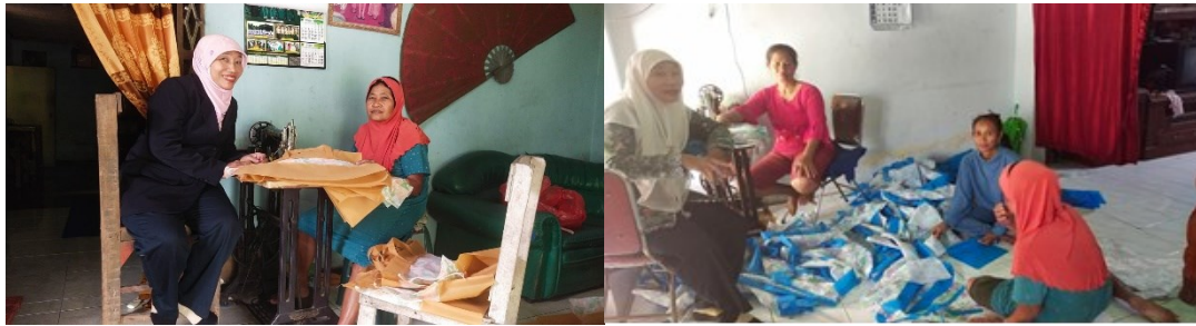
Gambar 2. Kegiatan Pendampingan Mental Kewirausahaan