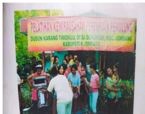
Gambar 1. Kelompok Pemulung

Kegiatan pendampingan mental kewirausahaan seorang dosen di Perguruan Tinggi pada masyarakat tertentu merupakan salah satu kegiatan pengabdian kepada masyarakat. Pendampingan mental kewirausahaan pada kelompok masyarakat tertentu bertujuan untuk menumbuhkan kreatifitas, semangat, menumbuhkan pemikiran prospek masa depan, sesuai dengan tulisan Suandi & Suwarno (2022) tentang arti penting entrepreneurship untuk menumbuhkan semua aspek karakteristik kewirausahaan dan pada akhirnya terjadi penyerapan tenaga kerja dan terjadi peningkatan pertumbuhan ekonomi. Kegiatan pendampingan kewirausahaan yang dilakukan dalam kegiatan ini di Dusun Karangtimongo, Desa Denanyar Kecamatan Jombang Kabupaten Jombang, kegiatan pendampingan semula dilakukan pada tahun 2010 dengan pada kelompok perempuan pemulung, bentuk kegiatan dengan pelatihan menjahit tas bahan dari kain dan pemasaran produk pesertanya berjumlah 25 peserta.