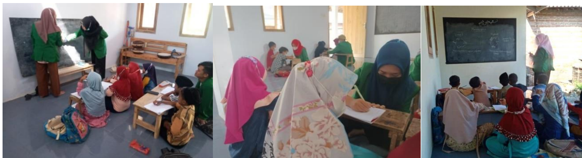
Gambar 2. Bimbingan Belajar Ceria Mata Pelajaran Matematika, Bahasa Inggris dan Sains

Pelaksanaan Bimbingan Belajar Ceria yang berjalan selama 6 minggu ini juga sebagai bentuk pengabdian para mahasiswa di masyarakat yang ditujukan kepada anak-anak pelajar usia Sekolah Dasar dan TK. Ini bertujuan supaya mereka bisa tetap mendapat pendampingan ketika melaksanakan pembelajaran online disaat orang tua mereka harus bekerja ataupun sibuk dengan kegiatan yang harus mereka selesaikan. Mereka terdorong untuk berangkat ke tempat bimbingan belajar dengan protokol kesehatan yang telah ditetapkan, sehingga hal ini mereka memiliki suatu tanggung jawab untuk belajar bersama para mahasiswa pendamping dibimbing belajar ceria sebagai ganti belajar di sekolah. Dengan adanya pendampingan yang diberikan dari Bimbingan Belajar Ceria, anak-anak akan merasa lebih mampu dan mudah untuk menyelesaikan tugas-tugas dari guru mereka. Pendampingan belajar ini mengarahkan dan memberikan pemahaman materi secara maksimal agar mereka termotivasi dan bersemangat untuk lebih rajin belajar. Hasilnya para orang tua tidak merasa cemas dengan proses belajar anak-anaknya selama Pandemi ini selagi mereka bekerja. Gambar 2 merupakan hasil dokumentasi yang didapat pada saat melakukan pendampingan di lokasi Bimbingan Belajar Ceria.